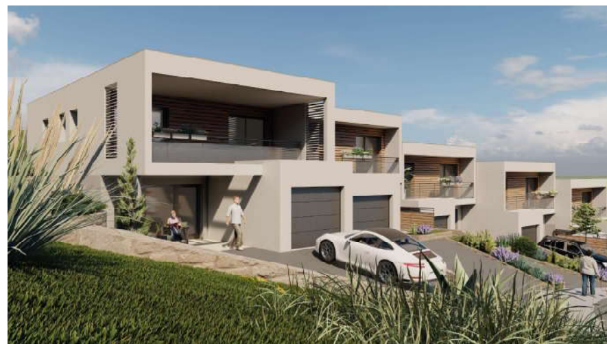
Maison 2- Niveau R+1