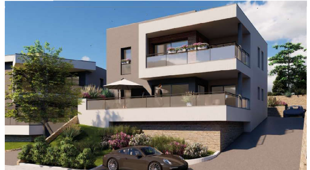
LOT 9- Niveau R+1