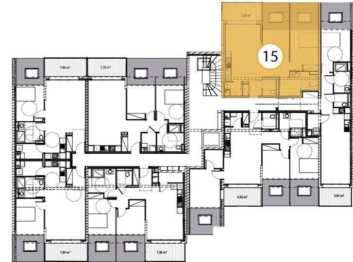
LOGEMENT 15 de TYPE F3 situé au R+2 m 2