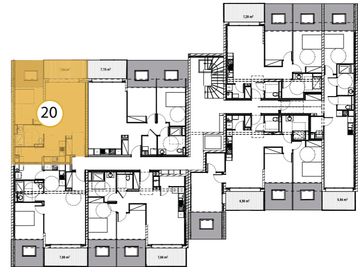
LOGEMENT 20 de TYPE F2 situé au R+2